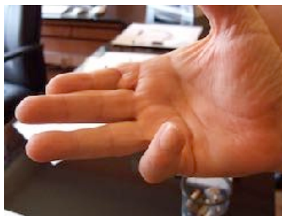
Dupuytren sévère: Tubiana stade 4

La maladie peut récidiver, ce qui est d'autant plus fréquent que l'évolution initiale a été rapide et qu'elle survient chez un sujet jeune. La maladie de Dupuytren est une maladie évolutive et la chirurgie ne fait qu'ôter les stigmates. Tous rayons et tous stades confondus le taux de récurrence varie entre 41% et 60% dans la littérature.