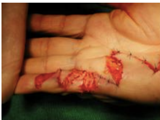
Exemple de greffe de peau (appelée greffe « coupe – feu »)

Une greffe de peau peut être nécessaire lorsque la peau est envahie ou s'il s'agit d'une récurrence. Cette greffe sera le plus souvent prélevée aux dépens du membre anesthésié (avant-bras ou bras) laissant une cicatrice filiforme. Un lambeau local vascularisé est parfois utile en particulier pour le 5e doigt ou pour une commissure inter-digitale.