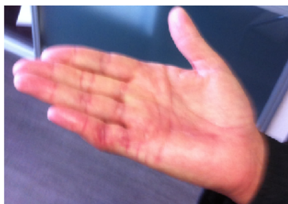
Exemple de cicatrisation après technique « paume ouverte »

Souvent, surtout dans les cas évolués, la paume de la main doit être laissée ouverte, c'est la technique de Mac Cash La cicatrisation se fait alors d'elle-même avec des pansements gras réguliers pendant 3 à 4 semaines.